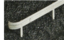
Avslutning med böj

Vid skarvning kan skarvjärnen limmas på baksidan av de båda bitarna som skall skarvas.